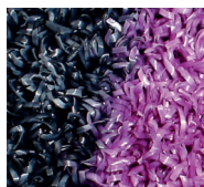
Tappeto da esterno